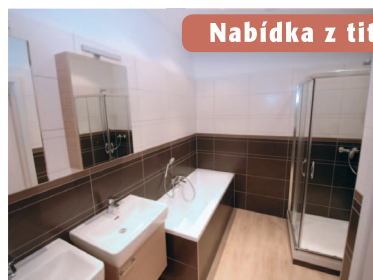
Nabídka z titulní strany katalogu.